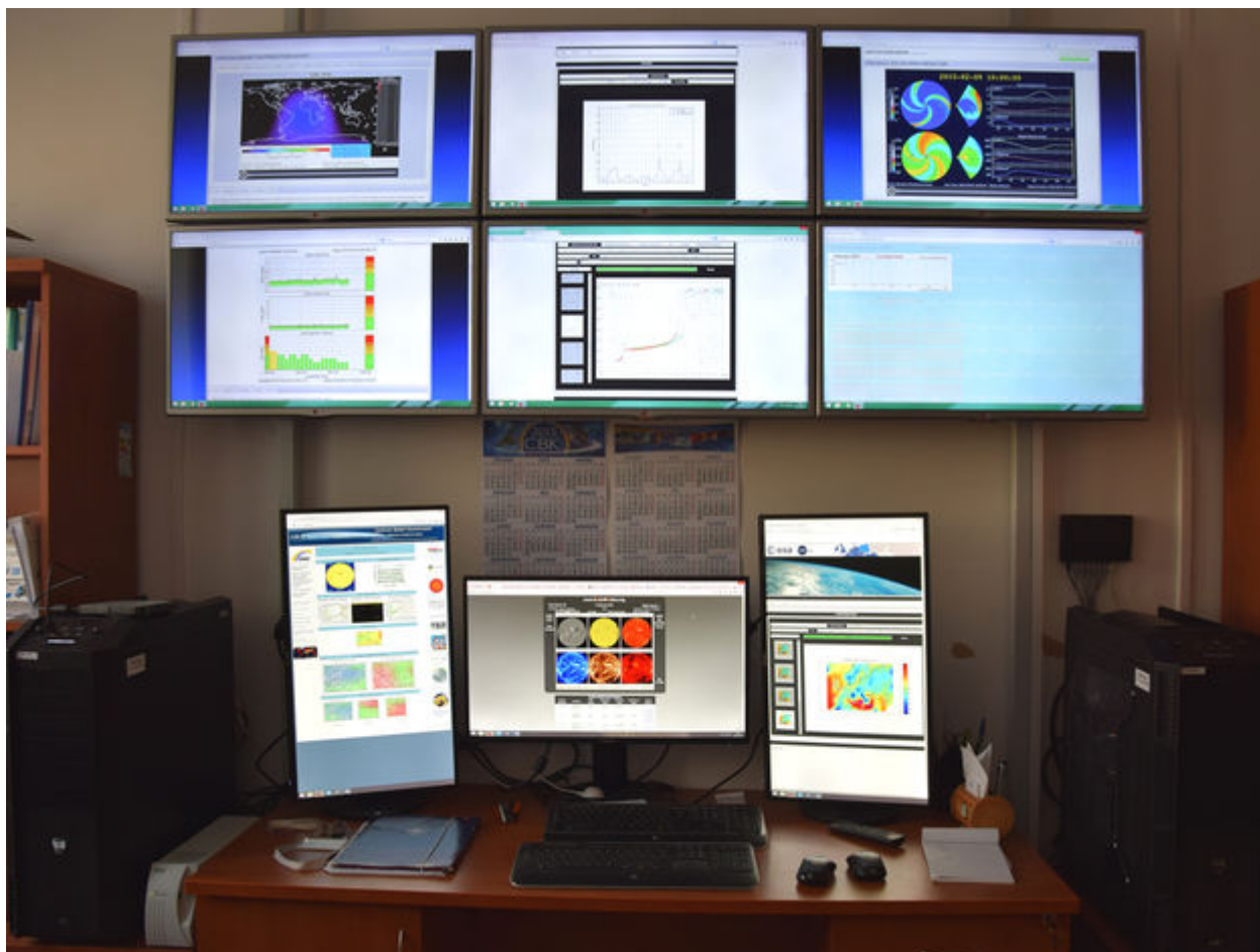
Stanowisko pracy kierownika Regionalnego Centrum Ostrzegania Warszawa.