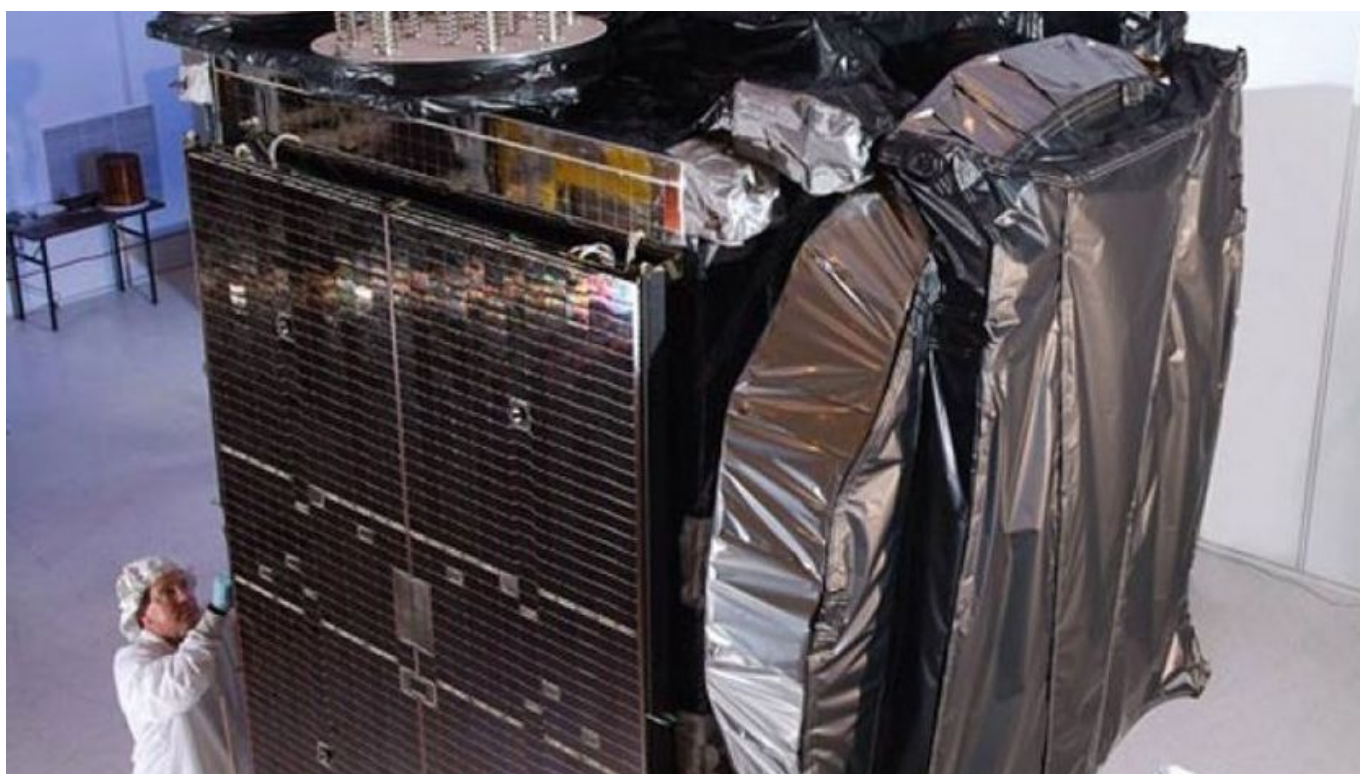
Satelita Galaxy 15 przed wystrzeleniem.

W 2010 r. komercyjny satelita telekomunikacyjny Galaxy 15 na orbicie geostacjonarnej stracił kontakt z Ziemią i zaczął wykonywać niekontrolowane ruchy. Na zatłoczonej orbicie GEO mogło to doprowadzić do wypadku. Kontrolę nad tym urządzeniem udało się odzyskać po kilku miesiącach. Inna znana sytuacja miała miejsce w 1998 r. kiedy to japoński skoczek narciarski Kazuyoshi Funaki skakał by zdobyć jeden z medali podczas igrzysk olimpijskich w Nagano. Ugięcie ziemskiej magnetosfery sprawiło, że japoński satelita telewizyjny znalazł się poza jej obszarem i w efekcie mieszkańcy Japonii nie mogli na żywo obejrzeć sukcesu swojego zawodnika.