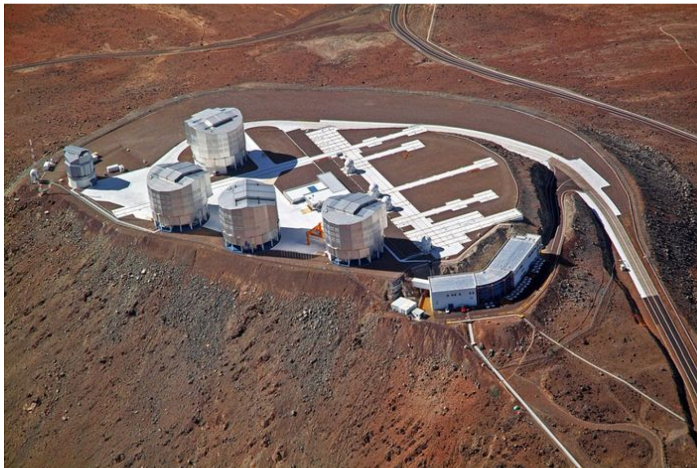
Bardzo Duży Teleskop (VLT) na szczycie Cerro Paranal.

Stworzyłem procedury konserwacji obudowy, teleskopów i lusterek. Największe tamtejsze zwierciadło ma 8 m średnicy i tylko 17 cm grubości, jest zatem bardzo delikatne i wrażliwe na uszkodzenia. Ażeby przeprowadzić konserwację zwierciadła obserwatorium Paranal potrzeba pięciu nocy, by je zdemontować i na nowo pokryć powłoką. Procedurę tę powtarzamy mniej więcej co 18 miesięcy.