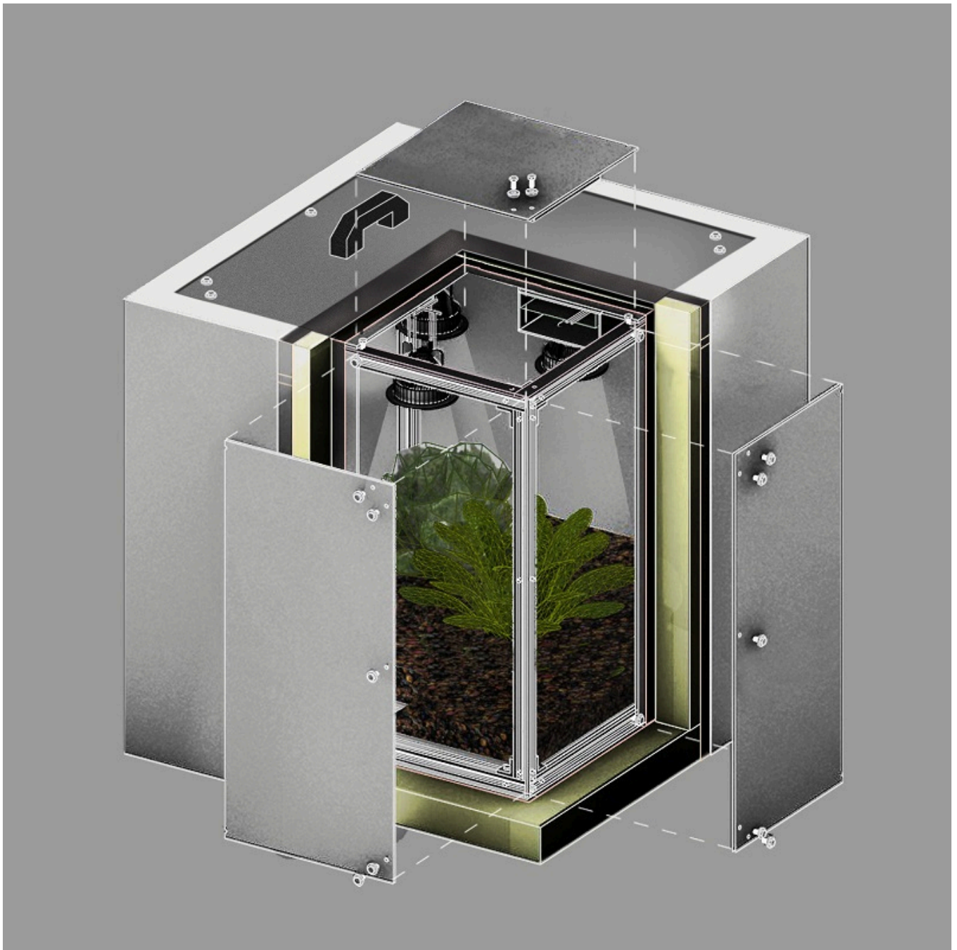
Schemat działania modułu SAMPLE. Ilustracja: Politechnika Warszawska [pw.edu.pl]

„Po wspinaczkę i podróż kolejką górską na wysokość 2132 metrów studentom udało się zainstalować moduł na skalistym, niełatwym terenie. Sterować mogli nim wyłącznie zdalnie. Organizatorzy zaplanowali przesyłanie danych przez internet z 2,5-sekundowym opóźnieniem, tak aby odzwierciedlić realia sterowania sprzętem znajdującym się w przestrzeni kosmicznej” - poinformowano na stronie internetowej uczelni. Po zakończonym etapie terenowym i sprawdzeniu modułu okazało się, że eksperyment się powiódł. „Połączenie rozwiązań technicznych z odpowiednio przygotowanym regolitem pozwoliło wykiełkować roślinom, a studentom - myśleć poważnie o kontynuowaniu projektu” - informuje Politechnika Warszawska.