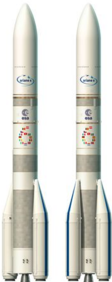
Ilustracja: ESA-David Ducros, 2017

Pierwszy start Ariane 6 ma, według obecnych prognoz, nastąpić w 2020 r. Ważnym momentem dla rozwoju projektu nowej europejskiej rakiety było spotkanie Rady Ministerialnej ESA w grudniu 2014 r. To wtedy zdecydowano, że budowa konkurencyjnej rakiety nośnej jest niezbędna, by Europa mogła pozostać liderem na szybko zmieniającym się rynku usług związanych z wynoszeniem ładunków w przestrzeń kosmiczną.