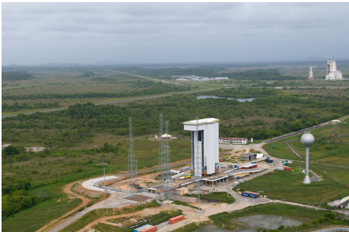
Stanowisko startowe dla rakiet Vega w Kourou w Gujanie Francuskiej.

Pod koniec września br. spółka Arianespace poinformowała, że podpisała kontrakt na zakup dziesięciu nowych rakiet Vega od ich włoskiego producenta, firmy Avio. Cztery z zamówionych pojazdów mają powstać w wersji „C”, przy czym trzy spośród tych czterech znalazły już klientów, którym posłużą do wyniesienia ładunków.