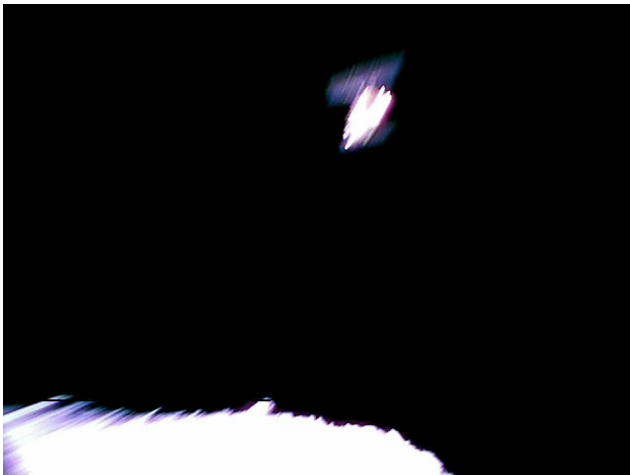
Sonda Hayabusa-2 (powyżej) uchwycona w trakcie przelotu próbnika Minervall-1A.

Ryugu jest planetoidą z grupy Apolla, okrążająca Słońce w ciągu 1 roku i 109 dni w średniej odległości odpowiadającej 1,19 dystansu Ziemi do Słońca. Została odkryta 10 maja 1999 roku w ramach projektu LINEAR. Planetoida otrzymała swoją obecną nazwę w październiku 2015 roku w ramach konkursu. Jej źródłem jest japońskie słowo Ryūgū-jō , zapożyczone od nazwy podwodnego pałacu władcy mórz w japońskiej legendy o Tarō Urashimie.