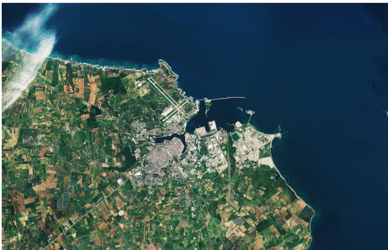
Wysokorozdzielcze optyczne zobrazowanie powierzchni Ziemi z jednego z satelitów Sentinel-2.

Zobrazowania optyczne mogą być bardziej przystępne w szczególności dla tych osób, czy podmiotów, które nie mają jeszcze wprawy w interpretacji czy przetwarzaniu zdjęć satelitarnych. Dzieje się tak, ponieważ, wśród zakresów widma promieniowania elektromagnetycznego pokrywanych przez sensory optoelektroniczne znajdują się również częstotliwości właściwe dla światła widzialnego. Stąd, tego typu obrazy, przynajmniej w pewnym zakresie, przypominają to, co widzi ludzkie oko. Dlatego mogą być nieco łatwiejsze do zinterpretowania.