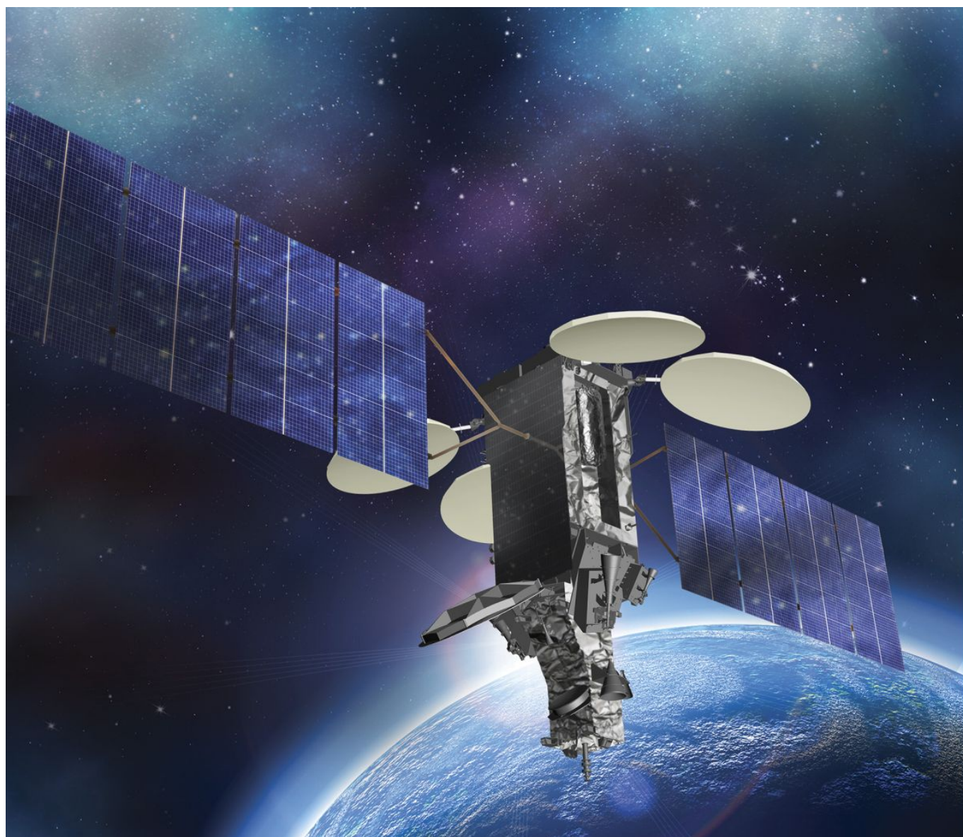
Artystyczna wizja satelity opartego na platformie LM A2100. Ilustracja: Lockheed Martin

Natomiast zakłady Lockheed Martin Space Systems już od lat 90-tych ubiegłego stulecia produkują platformę satelitarną A2100. Jest ona wykorzystywana przede wszystkim dla satelitów komunikacyjnych dedykowanych na orbity geosynchroniczne, ale wykorzystano ją również do budowy urządzeń globalnego pozycjonowania GPS Block IIIA oraz urządzenia meteorologicznego GOES-16.