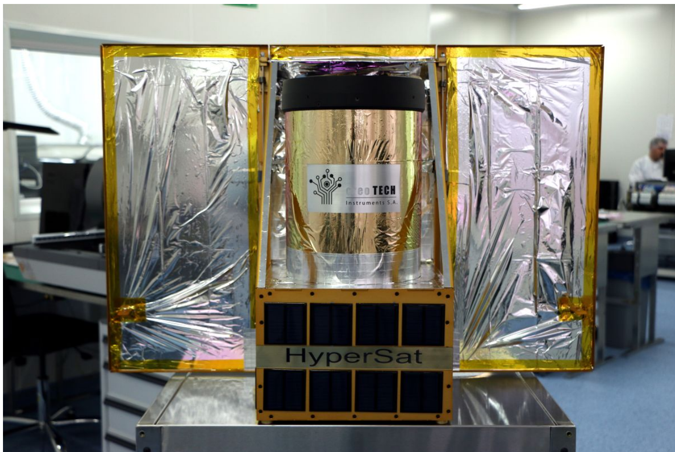
HyperSat - modułowa platforma satelitarna od Creotech Instruments.

W najmniejszej konfiguracji taki modułowy satelita będzie miał wymiary 30 x 30 x 10 cm i wagę 10 kg. System może być rozbudowywany do rozmiaru maksymalnego 30 x 30 x 60 cm i osiągnąć maksymalnie 60 kg wagi. Inżynierowie z Piaseczna planują również wdrożyć HyperSat BUS – innowacyjną magistralę satelity pozwalającą na zasilanie poszczególnych komponentów platformy i przesyłanie danych pomiędzy nimi w oparciu o nowy standard elektroniki SpaceVPX.