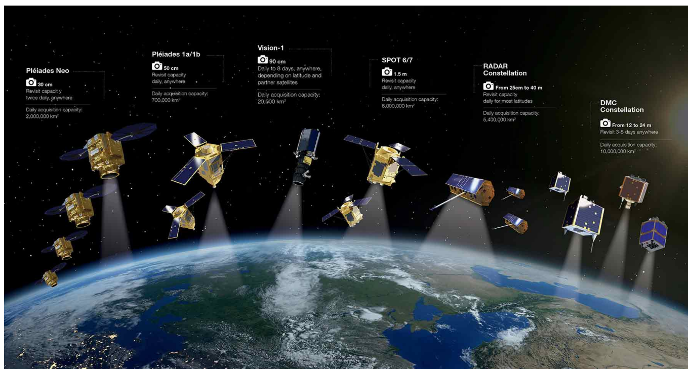
Ilustracja: Airbus Defence & Space [intelligence-airbusds.com]

Wobec przetargowego wymogu dostępności zobrazowań za pośrednictwem platformy internetowej, Airbus zadeklarował udostępnienie do tego celu platformy cyfrowej Airbus OneAtlas - umożliwiającej uzyskiwanie także danych archiwalnych Pléiades oraz powiązanych narzędzi analitycznych. Same instrumenty Pléiades 1A i -1B mają zapewniać oczekiwaną możliwość codziennej akwizycji obrazu satelitarnego dowolnego wybranego miejsca na świecie.