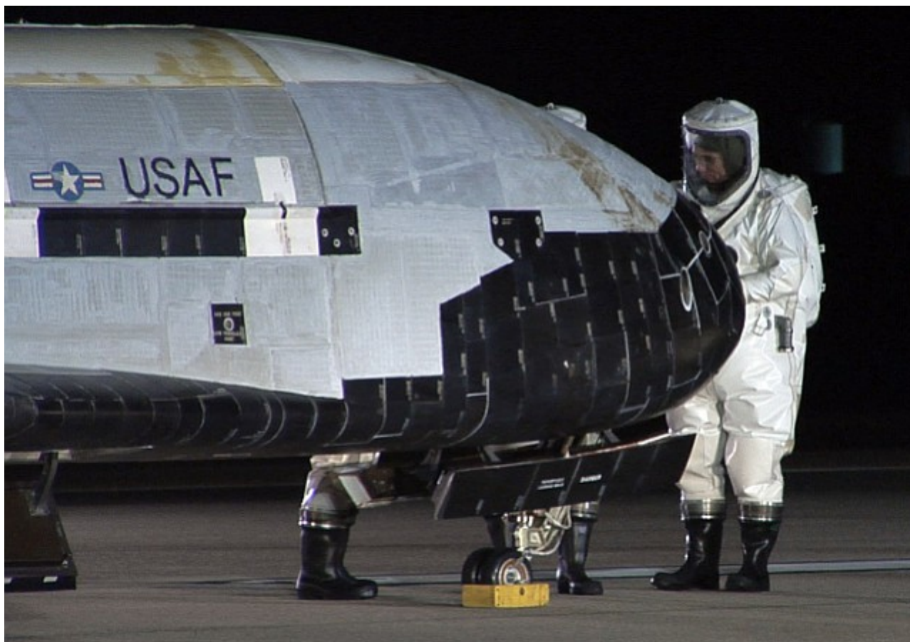
Wahadłowiec Boeing X-37B.

Czytaj też: Siły Kosmiczne USA? Odpowiedź Rosji będzie mocna!