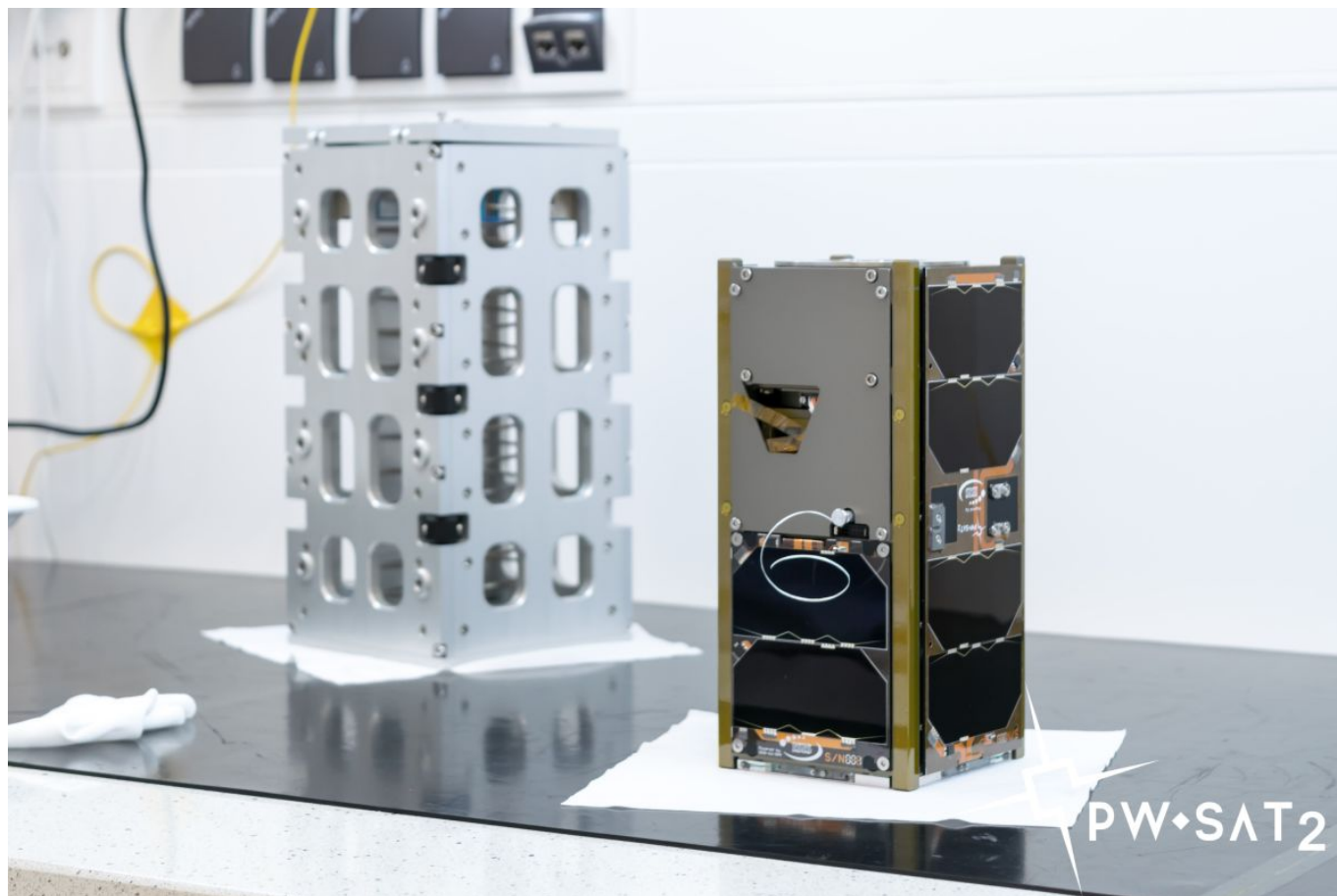
PW-Sat2 wraz z zasobnikiem testowym, w którym satelita będzie znajdował się podczas testów wibracyjnych.

PW-Sat2 jest satelitą zbudowanym w standardzie CubeSat 2U przez studentów ze Studenckiego Koła Astronautycznego na Politechnice Warszawskiej.