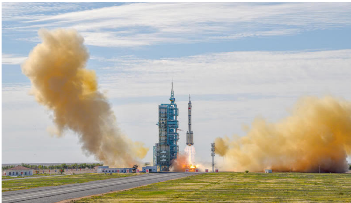
Start rakiety Chang Zheng 2F z trzema chińskimi kosmonautami - 17 czerwca 2021 r..

Obecna misja ma potrwać trzy razy dłużej - załoga statku kosmicznego Shenzhou 12 rozpoczyna już realizację zadań po połączeniu z cylindrycznym modułem budowanej stacji kosmicznej Tiangong (chiń. „Niebiański Pałac”), znajdującym się na wysokości 370 km nad Ziemią. W harmonogramie lotów poprzedzających ukończenie stacji (zaplanowane na 2022 rok), obecna misja jest trzecią z przewidzianych jedenastu. Zarazem jest to pierwszy transport załogi w kierunku niedawno wysłanego w kosmos załączka tego obiektu.